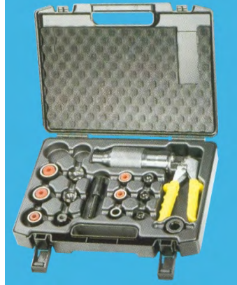
Coffret LS6 PG